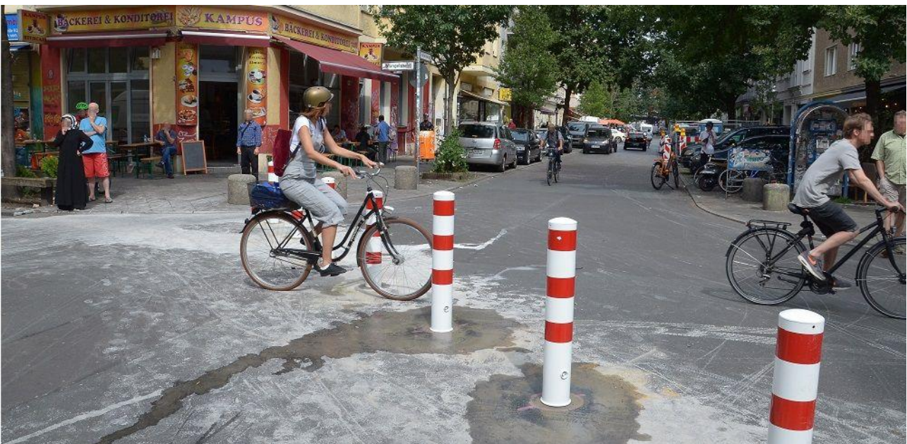
Abbildung 1: Modalfilter in der Wrangelstraße in Berlin

Verkehr galt in Deutschland lange Zeit als rein technische Angelegenheit: »Verkehrsraum ist Ingenieursraum«, hieß es. Die Fläche sollte berechenbar, quantifizierbar sein. Durch Verkehrsräume sollte möglichst viel Verkehr gepresst werden – und zwar nahezu ausschließlich Autoverkehr. Der öffentliche Raum war in den Augen der in den letzten Jahrzehnten hauptsächlich durch Männer dominierten Verkehrsplanung definitiv kein Ort für Gemeinschaft und Leben. Der Verkehrsraum bietet kein »Forum« für eine demokratische Kultur. Lebensqualität und Sicherheit sind von untergeordneter Bedeutung. Es werden nur die Bedürfnisse des männlichen Arbeitnehmers mit eigenem Auto bedient. Alles andere – spielende Kinder, Senior/innen, Familien etc. – werden an den Rand gedrängt – auch im wörtlichen Sinne.